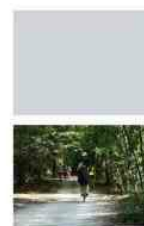
Il Consiglio di Gestione del Parco delle Groane ha deciso di